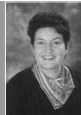
von Christiane Loy

Liebe Brennglas-Leserin, Lieber Brennglas-Leser!